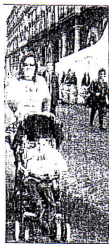
Pa alla III maratona